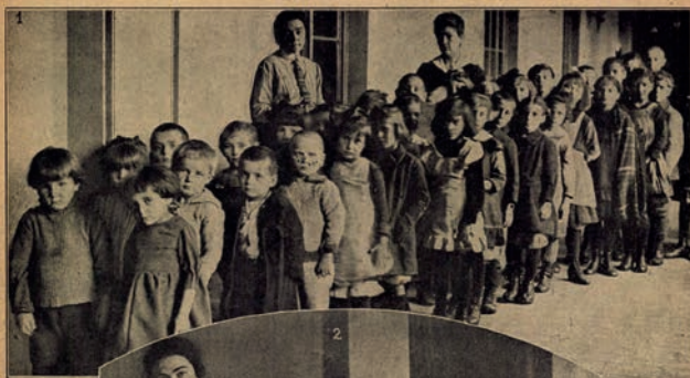
1 A főrendihá- ban öt terem engedték át a vagonokba gyermekeknek. — Képeink: 1. Mennék a gyere- kek a főren- diház folyosó- jára a játszóte- rembe. — 2. A