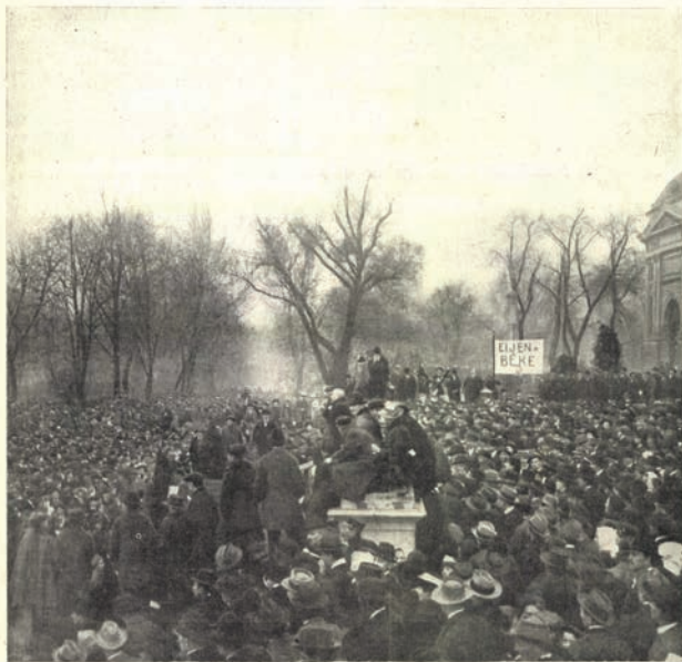
A FETNYÜLŐ FÉRFI A FÉRSZÉLETI VÁRSZÁRVAZÁS ELŐTT.

Beszámítandó ár: IV. Varságy-száma II. Részletenként: IV. Pápai-száma 4. Részletenként: IV. Pápai-száma 4. Előfizetés: 36. hóra. Előfizetés: 18. hóra. Külföldi előfizetőknek a postaköltséget különösen meg kell fizetni a kiadásért. Kiadóhely: Budapest, IV. Pápai-száma 4. Részletenként: IV. Pápai-száma 4. Részletenként: IV. Pápai-száma 4. Előfizetés: 36. hóra. Előfizetés: 18. hóra. Külföldi előfizetőknek a postaköltséget különösen meg kell fizetni a kiadásért.